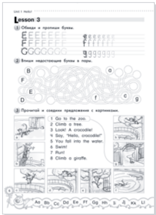
"Millie-2", AB, p. 6

Но так как целью подобной истории является обучение монологическому высказыванию, причем, у каждого ребенка должна получиться своя история, то нам необходимо продемонстрировать ребенку, как разбивается единство и где заменяемая часть. Подобная работа представлена в упражнении 3, страница 6 рабочей тетради и лучше всего этому посвятить время на уроке. И, конечно, сама история, а точнее варианты истории, представляемые детьми. Каждый ребенок должен рассказать свою историю перед всем классом или в подгруппах.