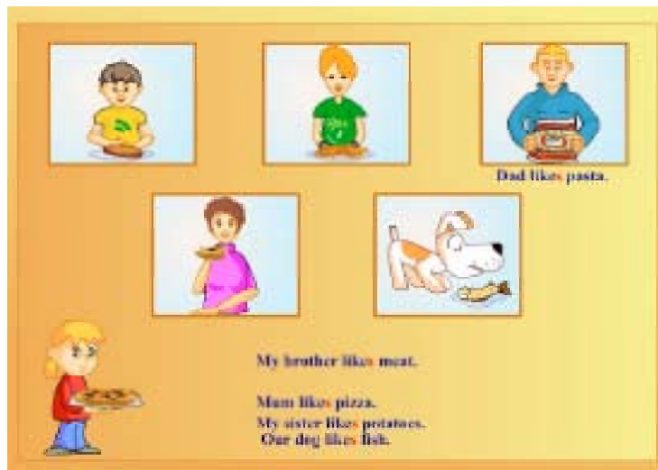
Unit 5 Lesson 2. Пример задания на чтение “целым словом”

При обучении говорению данная концепция предлагает использовать как фронтальные, так и групповые, и парные способы взаимодействия. При этом все способы взаимодействия разнообразятся за счет использования информационных технологий: реальный или виртуальный герой / учитель – реальный или виртуальный класс. Учащимся также предлагается создать виртуального героя, которого они идентифицируют с собой. Для создания виртуального героя в компьютерной программе предлагается некий конструктор, с помощью которого каждый ученик «сконструирует» именно такого героя, который больше всего ему нравится.