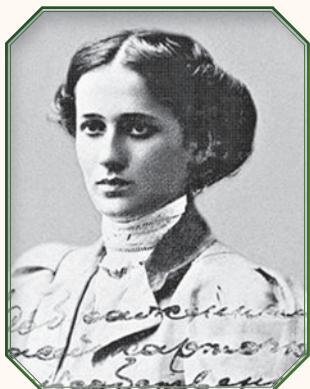
А. А. Ахматова в молодые годы