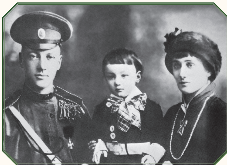
Н. С. Гумилёв с женой Анной Ахматовой и сыном Львом