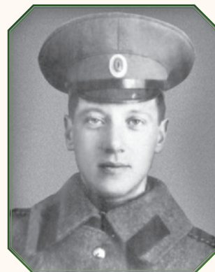
Н. С. Гумилёв во время Первой мировой войны