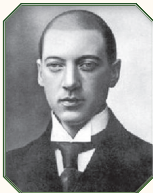
Н. С. Гумилёв в старших классах гимназии